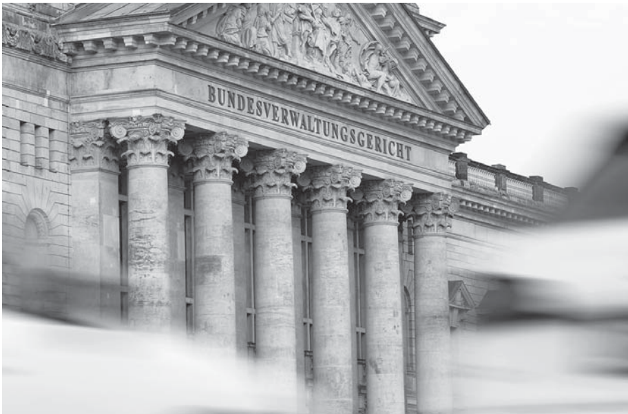
Bundesverwaltungsgericht in Leipzig

Will man die Entscheidung des BVerwG kommentieren – im Sinne einer Meinung dazu abgeben – dann könnte man sich kurzfassen und ausführen, dass die Problematik, über die zu entscheiden war, eindeutig und nachvollziehbar dargelegt wurde – und versuchen es noch etwas zu verdeutlichen. Im Gegensatz zu den letzten Entscheidungen des BVerwG, in denen es um Auslegungen (Anordnung einer medizinisch-psychologischen Begutachtung unter 1,6 Promille), europarechtliche Umsetzungen von Rechtsnormen (Fahrberechtigung ausländischer C- und D-Klassen) oder eine gefahrenabwehrrechtliche Einschätzung (Mischkonsum von Alkohol und Cannabis) ging, handelt es sich nun um die Darlegung eines klar beschriebenen Sachverhaltes im Straßenverkehrsgesetz. Letztlich geht es wieder einmal um die Definition der Begrifflichkeiten Tilgung, Tilgungsreife und Löschung. 1 Warum die Bedeutung dieser Begriffe und damit die Umsetzung dieser Begriffe immer noch Probleme bereitet, ist schwer nachzuvollziehen. Von Volker Kalus